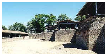
Les thermes gallo-romains de Chassenon

Matin : à 30 km sur la route du retour, visite guidée des thermes gallo-romains de Chassenon ( 1h30).