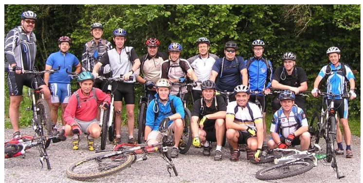
La section VTT au départ d'un circuit à Guéret