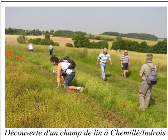
Découverte d'un champ de lin à Chemillé/Indrois