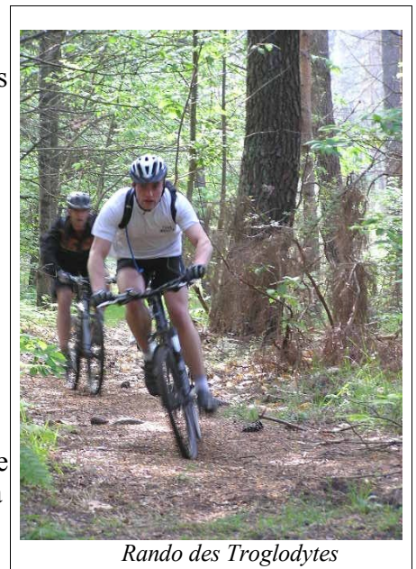
Rando des Troglodytes

Suite à ce C.M., les représentants des associations envoient une lettre recommandée au maire avec copie à tous les élus afin de dénoncer les libertés prises par certains propriétaires avec le code rural (étangs, barrières et constructions sur les chemins ruraux) et lui demander de prendre des mesures pour faire respecter la loi. Pas de suites pour l'instant. Mais saluons l'initiative d'un conseiller de l'opposition, membre de notre association, de mettre à l'ordre du jour de chaque C.M. à venir la question des chemins communaux.