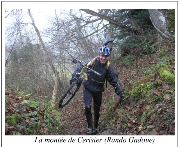
La montée de Cerisier (Rando Gadoue)

– Rendez-vous fut pris samedi 14 avril au moulin de Varanne pour nettoyer et baliser ensemble les CR 59 et 83, de la route basse à la D15. But : créer le fait accompli afin de voir comment réagiront les propriétaires et la mairie (force est de constater qu’ils ont fait le dos rond). Mais nous avons marqué ainsi notre volonté de continuer et d’aboutir. De plus un bon article dans la Nouvelle République nous a permis de rendre publique notre action et de la populariser.