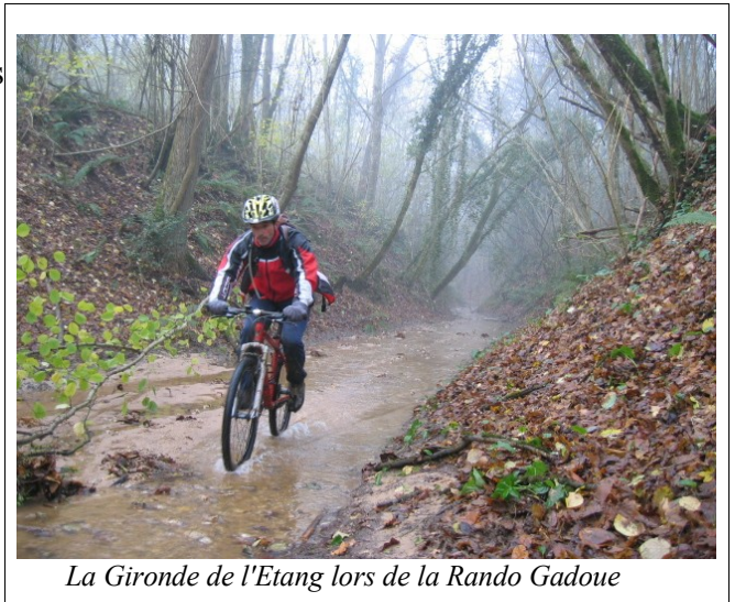
La Gironde de l'Etang lors de la Rando Gadoue

➤ en appelant à l'aide et à la solidarité de toutes les associations intéressées (mieux vaut tard que jamais...)