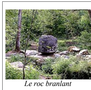
Le roc branlant

Digestion libre avec hébergement en chambres d'hôtes de 2 à 4 personnes dans un rayon de quelques kilomètres, petit déjeuner inclus pour environ 20 € par personne.