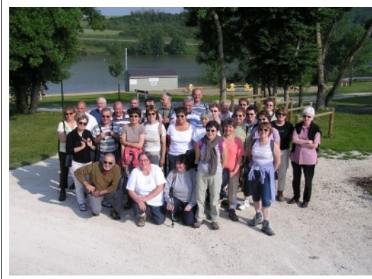
La section randonnée pédestre au bord du lac de Chemillé/Indrois

En plus des 2 randos record citées ci-dessus, les randos pédestres mensuelles ont rassemblé 438 participants (440 l'année précédente).